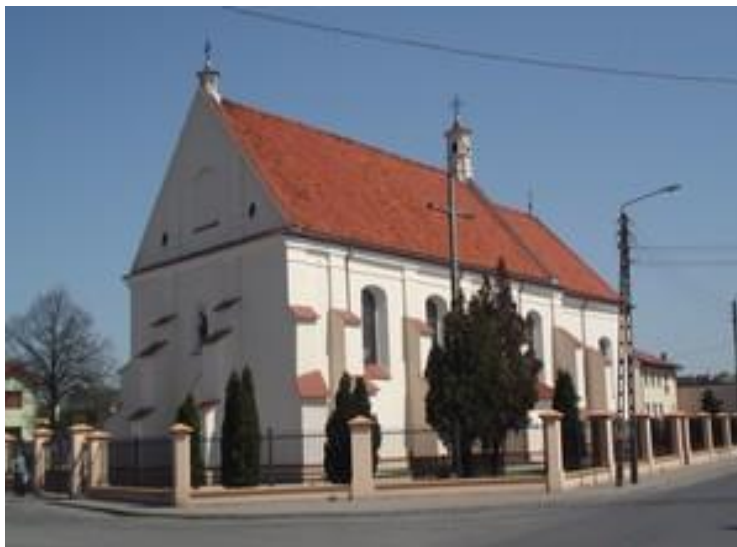
Zdjęcie 9 Kościół pw. Św. Trójcy w Piątku.

p.w. św. Trójcy , wzniesiony około 1460 roku, gotycki w bryle, orientowany, murowany z cegły i otynkowany, jednonawowy z węższym prostokątnym prezbiterium. Od południa przy nawie kruchta, od północy zakrystia duża i ministrancka, sklepienie kolebkowo, oraz kaplica NMP o stropie płaskim, belkowanym, malowanym w motywy roślinne. W nawie i prezbiterium stropy płaskie, otwór tęczowy ostrołukowy. Na zewnątrz kościół oszkarpowany, okna gotyckie przebudowane, dachy dwuspadowe, nad kaplicą i zakrystią – pulpitowy. Wewnątrz kościoła bogate wyposażenie, głównie barokowe. Ołtarz główny, późnobarokowy, pochodzi z kościoła Dominikanów w Łowiczu. W nim dużych rozmiarów obraz Świętej Trójcy namalowany w 1894 r. przez Józefa Buchbindera. W kaplicy Matki Boskiej – ołtarz barokowy z obrazem Matki Boskiej z Dzieciątkiem w sukience z ok. 1720 r. oraz wymiennym obrazem św. Marii Magdaleny.