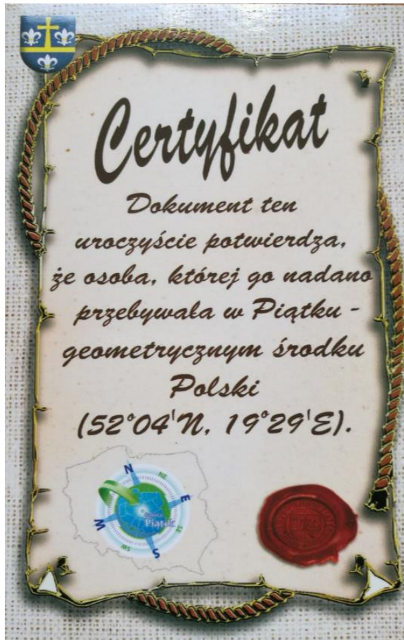
Zdjęcie 1. Certyfikat wydawany przez Urząd Gminy w Piątku.