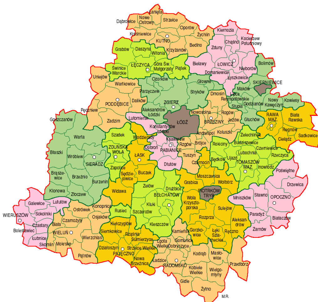
Mapa. 1. Położenie gminy Piątek w powiecie i województwie łódzkim.